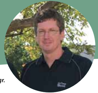
Par Dominic Bélanger, Agr.