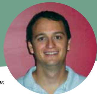
Par Mathieu Benoit, Agr.